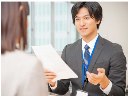
(左) 三宅町企業立地ガイド (右) ビジネスサポート事業のイメージ図 ※KoCo-Biz・・・2020年12月よりはじまった 広陵町と大和高田市が運営する「中小企 業のための無料の経営相談所」