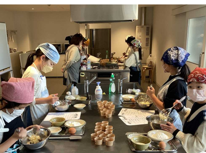
(上) MiiMoホールを使用した太極拳教室