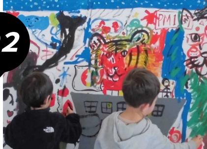
(右上) まちアート三宅町 (左上) 子育て世代包括支援センター (左下) 光のパレード