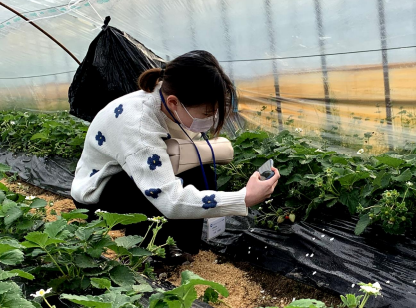
(上)学生プロモーターによる ふるさと納税町内業者の取材風景