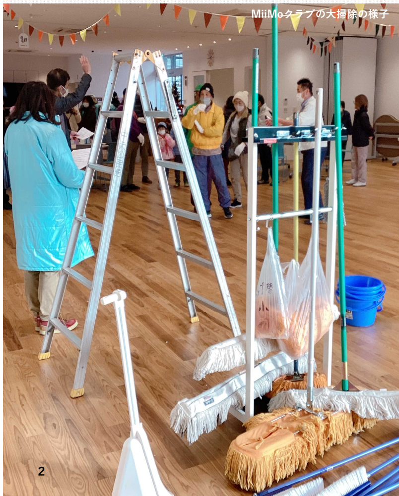
MiiMoクラブの大掃除の様子

住宅）の課題を検証し、今後の適正な管理・運営のあり方の検討を行うため、公営住宅あり方会議を行いました。